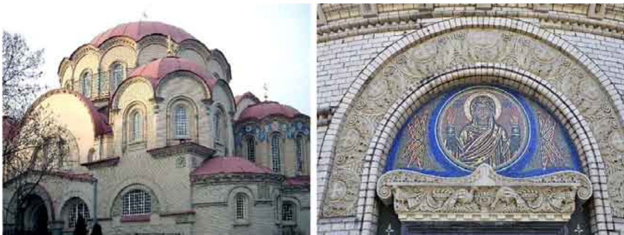
喀山圣母教堂——20世纪

建于1907—1914年喀山圣母教堂是新圣女修道院的再版，位于圣彼得堡市，是另外一座具有改良拜占庭风格的精美作品。