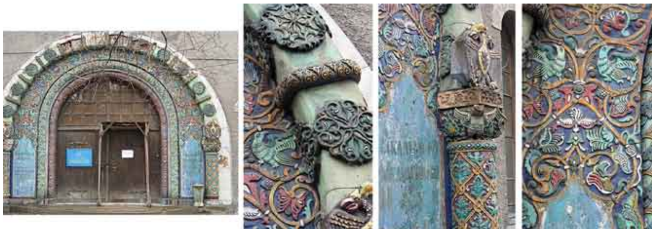
俄罗斯实验医学研究所图书馆——20世纪

清真教堂的设计工作由才华横溢的艺术家和陶瓷师彼得·沃琳领衔，他的作品对19世纪之交的圣彼得堡市内的马爵利卡陶瓷装饰艺术增添赋予了新的内涵。沃琳工作室负责建造的唯一新俄罗斯陶瓷艺术风格的宏伟作品仍然在圣彼得堡市留存，即俄罗斯实验医学研究所图书馆的大门。