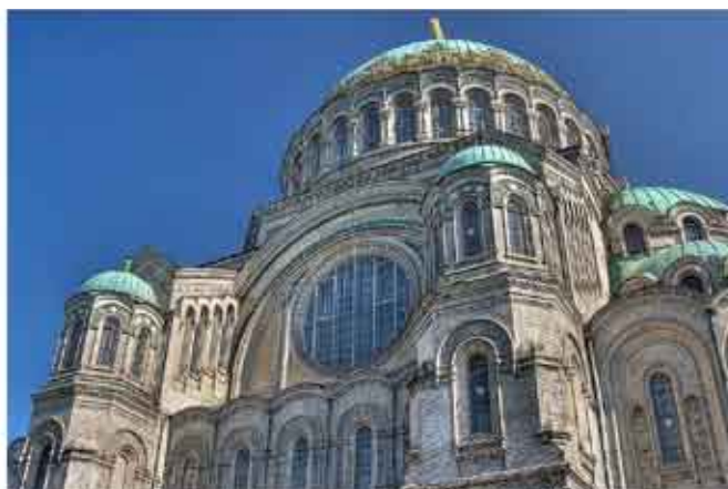
科特林岛上的喀琅施塔得海军大教堂——20世纪