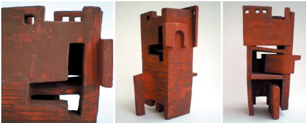
(图) 阿瓦诺斯2手工制作的陶器, 2007

林奇在他的《此城的肖像》一书的介绍中写道“尽管可能是平凡的景色，注视这座城市可以带给你享受。如同一件建筑，这个城市像空中楼阁，一个巨大尺寸的楼阁，一座只有经过长期的积累才能感知的楼阁……在任何时刻，这里都有眼睛看不到的，耳朵听不到的有待发现的景色”卡普都西亚地区的外观沿着山坡形成了一幅巨大的马赛克，刻进岩石的马赛克，她的前面是石块构成的，远远望去如同编织的图画……这是一幅拼贴画，画中一间房子的阳台恰好是另外一间房子的屋顶，远远望去的一件拼图。进入到内部，拼图变成了复杂的迷宫。对我来说，这里的景致是视觉材料的源泉，我取下这里的窗，门，墙和段落拼成我的画面。