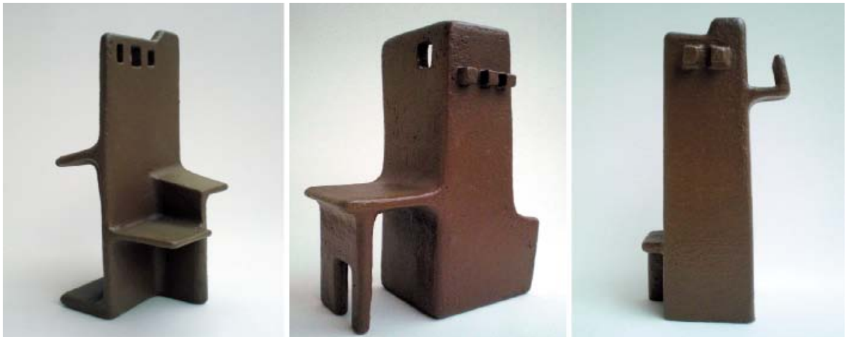
建筑学拼贴系列的例子手工制作的陶器，2010

有时，通过我的窗户射到我家墙壁上的影子、我初次路过的街道两旁的房屋、驾车时见到的拆除过程中的房屋、安纳托利亚北部乡村的小木桥、上海蓝色的摩天大厦、墨西哥印地安人的房屋或者一万六千年前哈图沙（古代赫梯帝国首都，现土耳其境内）的土坯墙都会在我的脑子里被重新构建。墙壁变成了陶瓷的，内部的空间充满了我自己的现实。