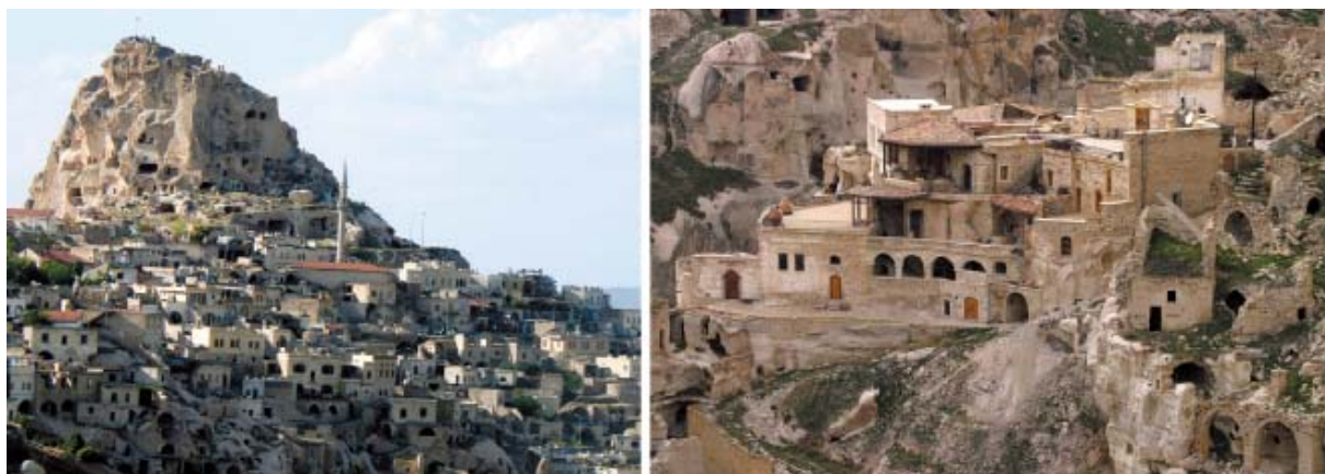
(图) 卡帕多西亚的建筑(土耳其,内夫谢希尔省)

考虑到土耳其不同气候条件下的地区保留下来的地方建筑的质量,木材,石材和砖坯得到了巧妙的应用。在大学读书时,我有很多机会欣赏北部阿纳托利亚的传统木制建筑,让我以艺术的理解力来考究这些建筑系统,并且,作为我的硕士论文的内容,我用陶瓷材料诠释了它们。对木制建筑的探究成了我的探索过程主要的练习,我试图用我对陶艺的认识来翻译建筑语言。