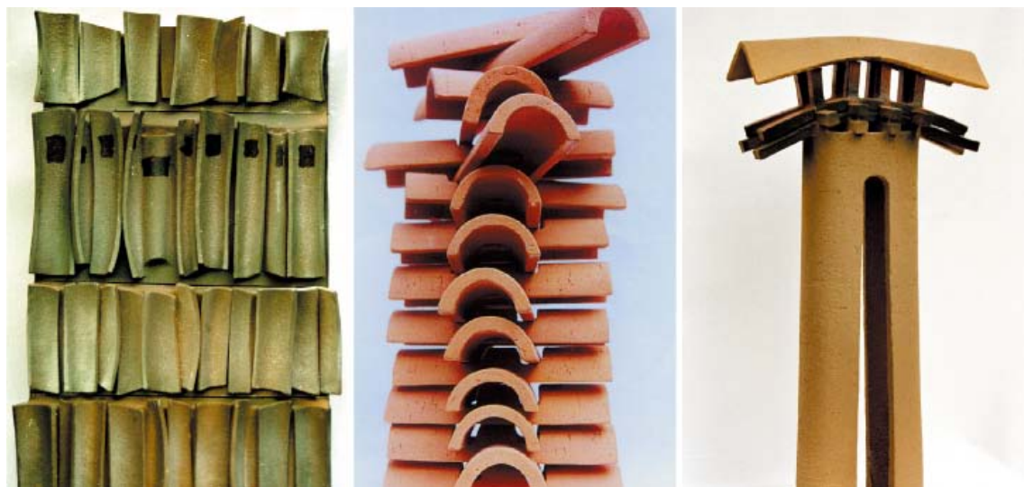
(图) 木制建筑系列,陶器粘土,手工制作,2000

回忆我最初接触陶瓷时,我记得那时我认为不管功能如何,包含什么意义,设计的色彩或装饰如何,这个器型与一面墙壁比较也没有什么特殊的。陶艺实践课堂上我的指导教师说“陶艺是创造体积的艺术”,我对这句话的真正理解是在我创作出具有建筑学效果的作品之后。然而,用金属焊接的结构,用塑料成型的器具,雕刻的大理石和木料都具有体积。因此,不同之处仅仅在于陶瓷的材料是泥土。如果因为技术的原因人们把粘土烧成具有一定的厚度,与其它材料相比,陶瓷壁的构成技术难道更加困难,更加苛刻?在那时我开始了解陶艺的,心中充满问题的时期,当我明白了陶器创造了空和虚的时候,我对陶艺的认识得到了迅速的提升。