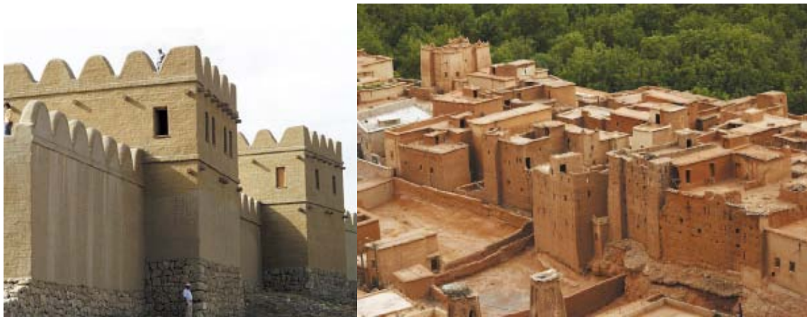
（图）粘土建筑 左边：砖坯建筑。重建的摩洛哥城的一部分 右边：砖坯建筑。拉河谷土耳其含土沙的墙（公元前16世纪）

对孩子来说挖出潮湿的沙土容易而且有趣。对绝大多数孩子来说，在身边堆起潮湿的沙土后用容器做模子，用成型的沙土建造东西是十分普遍的。如拉斯姆森所描述的，这种游戏在艺术的一个分支得到延续来满足人们的需要，创造动人的，美妙的居所，成年人称此为建筑学。