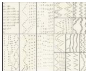
古老的几何图案，具有节奏感，基本元素结合的半示意图。

这个堆被破坏的很严重，发掘出的500多块陶片中找不到3块属于同一个陶器，无法还原任何一件陶器。这些碎片的加工和修饰方法是一致的，我们吃惊地发现当时的人们故意毁掉他们的陶器，也许是因为要往另外的栖息地转移，我在前面也提到了这个习惯。