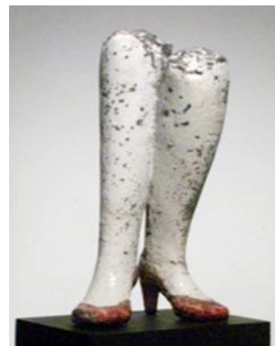
女士的红色高跟鞋