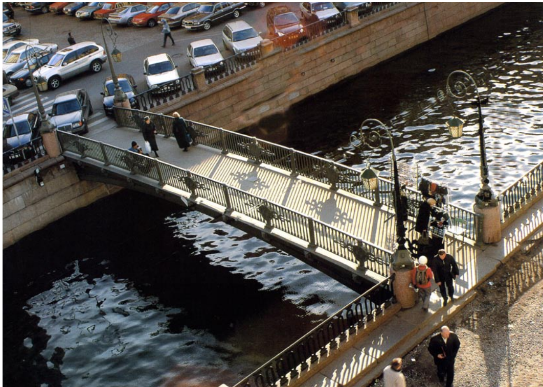
圣彼得堡的意大利桥