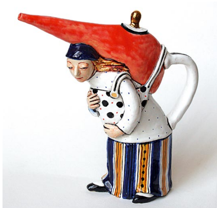
茶壶 耐火粘土, 釉上添釉, 釉