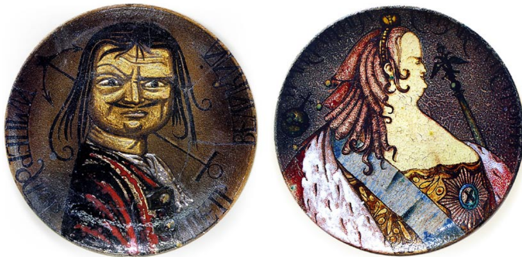
两个装饰性的盘子：彼得大帝，凯瑟琳一世（耐火粘土、泥，釉制）