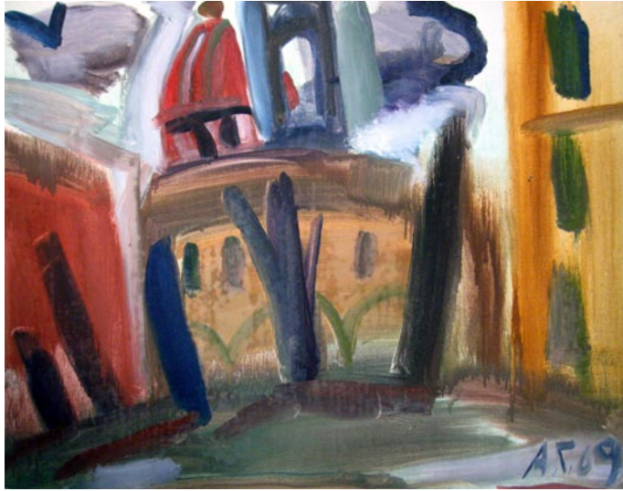
假日的夜晚 水粉画