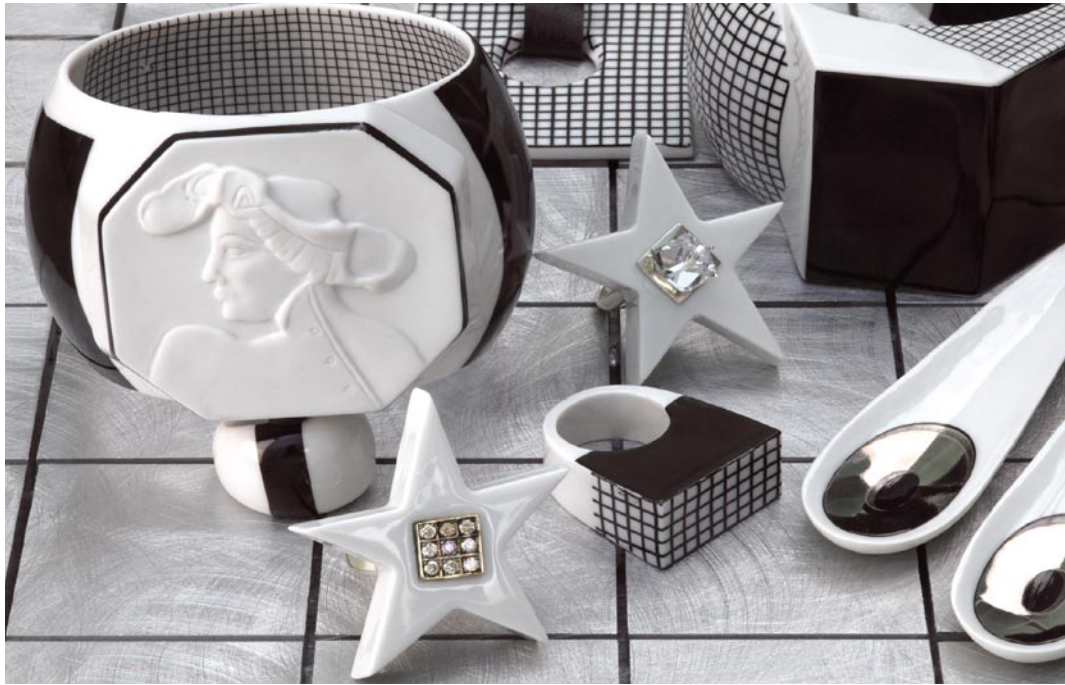
法爱德拉 珠宝系列 瓷泥, 银, 水晶