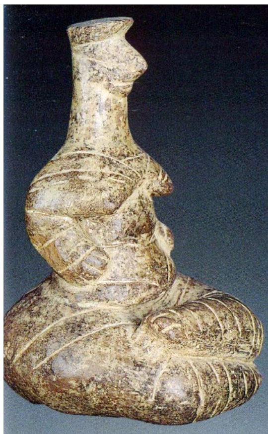
（图 8）新石器时期的作品

最后我想提及我有幸参加的研讨会。与来自世界各地的陶艺家切磋技艺的机会，见识具有不同文化背景的陶艺家以独特的手法处理作品是无价的。即使不能立竿见影，我还是感觉到了这种交流对我的推动，拓展了我的视野，影响着我对陶艺的认知。