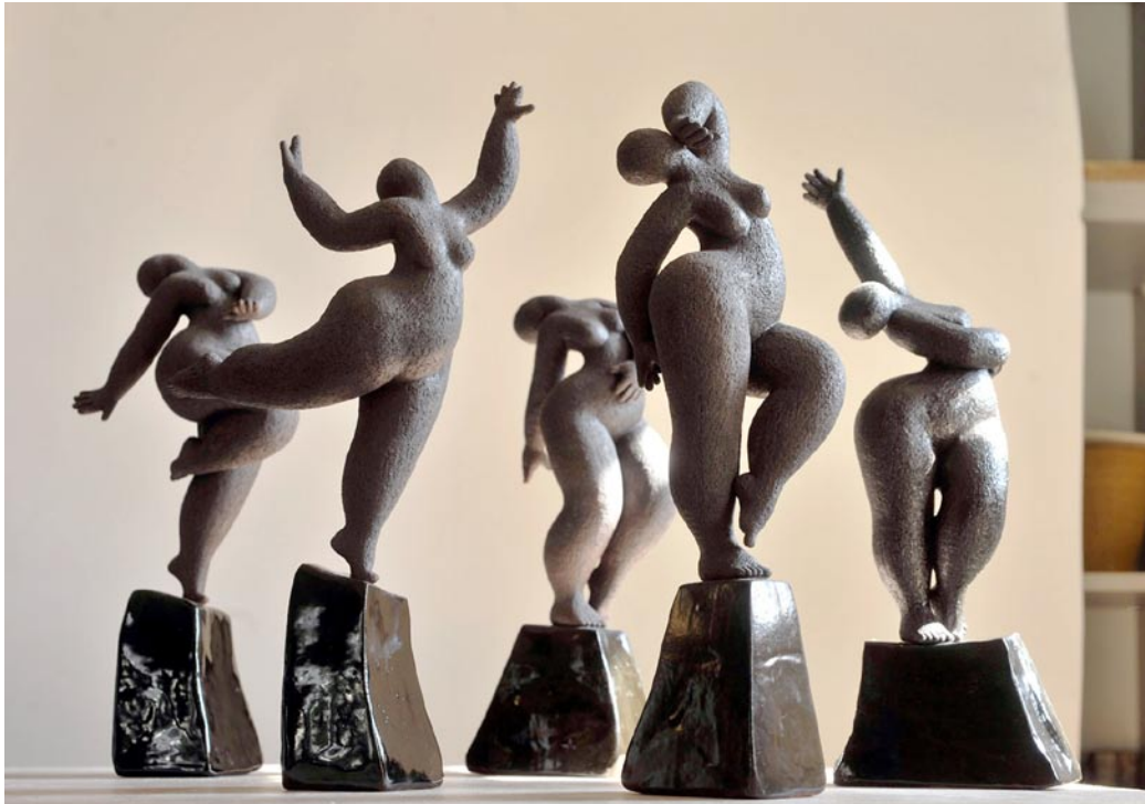
(图 9) 考斯玛作品